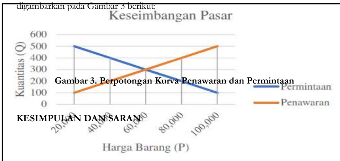
Gambar 3. Perpotongan Kurva Penawaran dan Permintaan

Kemudian keseimbangan pasar secara aljabar didapatkan dengan mengerjakan persamaan linier antara fungsi penawaran dan permintaan secara simultan. Secara geometri dapat ditunjukkan dengan perpotongan kurva penawaran dan permintaan yang digambarkan pada Gambar 3 berikut: