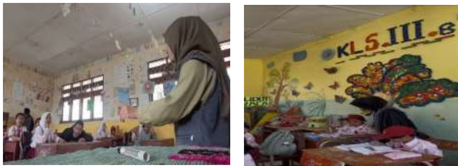
Gambar 5. Kegiatan Mengajar di SD Negeri 040480 Suka Ndebi

Pada aspek ini kegiatan yang dilakukan berupa Perkenalan/Mengajar di SD N 040480 hasil dan capaian kegiatan ini ialah Membangun komunikasi awal dengan 120 siswa SD, meningkatkan kesadaran siswa tentang pentingnya pendidikan, dan disambut positif oleh pihak sekolah.