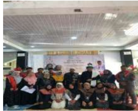
Gambar 2. Kegiatan Tablig Akbar untuk Memperingati Maulid Nabi