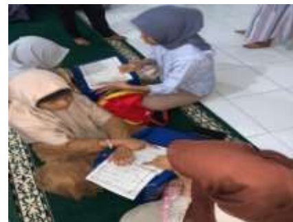
Gambar 3. Kegiatan Magrib Mengaji