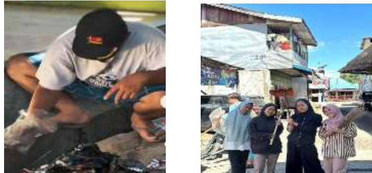
Gambar 4. Kegiatan Gotong Royong Membersihkan Lingkungan