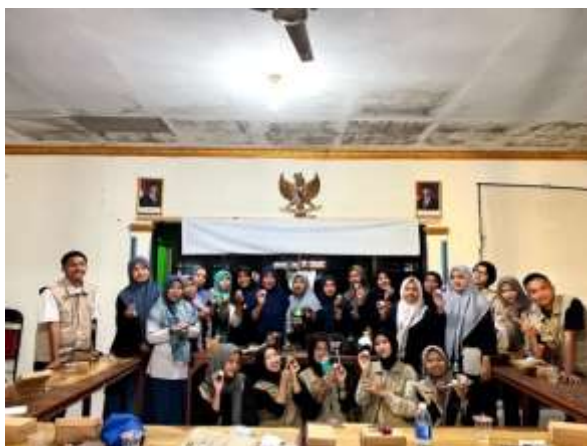
Gambar 9. Sosialisasi pembuatan lilin aromaterapi bersama ibu-ibu PKK

Minyak jelantah adalah minyak goreng bekas yang digunakan berulang kali dalam aktivitas memasak di rumah. Kebiasaan memakai minyak secara berulang dapat menimbulkan efek negatif bagi kesehatan tubuh serta lingkungan. Limbah minyak jenis ini juga termasuk salah satu jenis buangan rumah tangga yang jumlahnya terus meningkat dari waktu ke waktu. Lilin aromaterapi merupakan lilin yang dikembangkan dari lilin biasa dengan memanfaatkan bahan-bahan yang mudah diperoleh, salah satunya minyak jelantah sebagai bahan utama, ditambah minyak aromaterapi untuk memberikan aroma yang menenangkan dan relaksasi. Kegiatan ini bertujuan untuk meningkatkan pemahaman warga mengenai dampak penggunaan dan pembuangan minyak jelantah terhadap kesehatan dan lingkungan, memberikan wawasan tentang produk yang dapat dibuat dari minyak