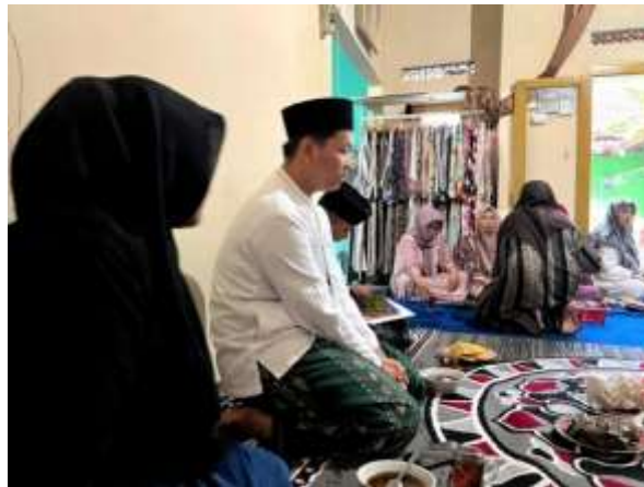
Gambar 2. Sosialisasi pemilahan sampah kepada ibu-ibu jam'iyah

Pemilahan sampah merupakan suatu proses menangani sampah mulai dari pengumpulan, pemilahan, pengangkutan, pemrosesan, serta pemanfaatan kembali untuk mengurangi volume sampah yang dibuang ke lingkungan (Setyaningsih & Maesaroh, 2021). Sampah dapat dikelompokkan menjadi tiga jenis utama, yaitu organik, anorganik, serta sampah B3 (Bahan Berbahaya dan Beracun). Masing-masing memiliki karakteristik yang berbeda sehingga cara pengelolaannya juga tidak sama. Sampah organik merupakan sisa yang berasal dari makhluk hidup seperti tumbuhan, hewan, maupun manusia. Jenis sampah ini dibagi lagi menjadi dua bentuk. Pertama , organik basah yang mengandung kadar air tinggi, misalnya sisa sayur dan kulit buah. Kedua , organik kering yang memiliki kadar air lebih sedikit, contohnya daun gugur, potongan kayu atau ranting, serta kertas. Berbeda dengan itu, sampah anorganik merupakan hasil dari bahan non-hayati atau produk buatan manusia yang melalui proses industri. Sampah ini sulit terurai secara alami, misalnya plastik, botol minuman, dan kaleng. Selain kedua jenis tersebut, terdapat pula limbah B3 yang mengandung zat beracun dan berbahaya. Kandungan bahan kimia di dalamnya dapat memberikan dampak buruk terhadap kesehatan manusia dan lingkungan, baik secara langsung maupun tidak langsung apabila tidak dikelola dengan benar (Aulia et al., 2024).