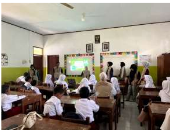
Gambar 5. Proses kegiatan sosialisasi pemilahan sampah

Pemilahan sampah adalah sebuah tindakan terencana untuk mengelompokkan sampah sesuai dengan karakteristik dan jenisnya, misalnya sampah organik yang mudah terurai, sampah anorganik yang masih dapat didaur ulang, serta sampah residu yang sulit dimanfaatkan kembali (Simatupang et al., 2021). Kegiatan pemilahan sampah bagi siswa dilakukan untuk mengenalkan cara mengelompokkan sampah berdasarkan jenisnya melalui penjelasan sederhana dan praktik langsung, sehingga siswa dapat memahami pentingnya menjaga kebersihan serta mulai membiasakan diri memilah sampah dengan benar di lingkungan sekolah.