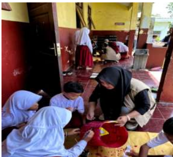
Gambar 6. Proses pembuatan tong sampah dari galon bekas

Pembuatan tong sampah dari galon bekas merupakan proses merancang dan menyediakan tempat penampungan sampah yang bertujuan untuk membantu masyarakat membuang sampah pada tempat yang tepat sesuai jenisnya (Dewi et al., 2024). Pembuatan tong sampah dari galon bekas merupakan upaya menghadirkan sarana pemilahan sampah yang sederhana dan mudah dijangkau di lingkungan sekolah. Kegiatan ini dilakukan karena masih banyak siswa yang belum memiliki kebiasaan membuang sampah sesuai jenisnya