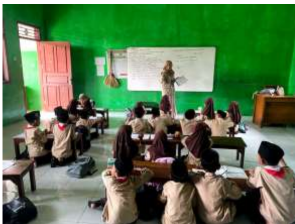
Gambar 7. Proses kegiatan mengajar MI Salafiyah

Mengajar tambahan adalah kegiatan pendampingan belajar yang diberikan di luar jam pelajaran utama untuk membantu siswa memahami materi secara lebih mendalam, memperbaiki kesulitan belajar, serta meningkatkan kemampuan akademik melalui penjelasan, latihan, dan bimbingan yang lebih terarah. Kegiatan mengajar tambahan di MIS Karangdadap dilaksanakan sebagai upaya untuk meningkatkan pemahaman siswa terhadap materi pelajaran