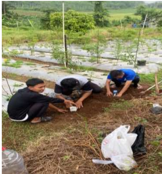
Gambar 10. Sosialisasi biopori

Biopori merupakan teknik sederhana yang bersifat ramah lingkungan dan bertujuan membantu mempercepat penyerapan air hujan ke dalam tanah (Abdulloh et al., 2024). Ketika air dapat meresap dengan baik, ketersediaan air tanah pun meningkat dan dapat dimanfaatkan sebagai sumber air bersih. Selain berperan dalam meningkatkan cadangan air tanah, biopori juga berfungsi mencegah terjadinya genangan, banjir, erosi, maupun longsor. Pengisian lubang biopori dengan sampah organik turut memberikan manfaat tambahan, yakni mengurangi volume sampah rumah tangga dan menghasilkan kompos alami yang mampu memperbaiki kesuburan tanah. Dengan memanfaatkan lubang kecil dan sampah organik yang tersisa di lingkungan, wilayah perkotaan yang semula gersang dapat berubah menjadi lingkungan yang lebih hijau, sehat, dan berkelanjutan (Badu et al., 2023).