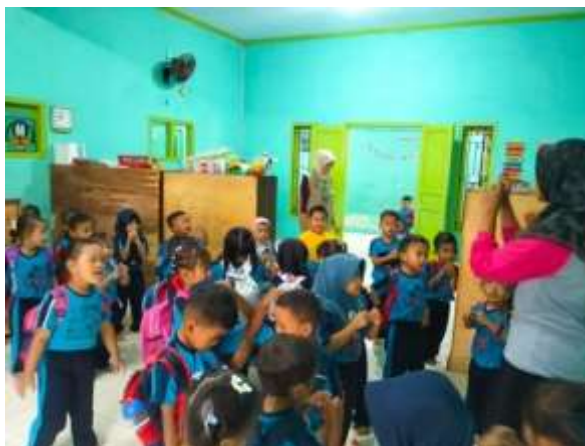
Gambar 8. Proses kegiatan mengajar di Paud Menur

Kegiatan mengajar di PAUD Menur merupakan salah satu bentuk pengabdian mahasiswa yang bertujuan untuk menumbuhkan minat belajar, keterampilan dasar, serta karakter positif pada anak usia dini. Pada tahap awal, mahasiswa melakukan observasi untuk mengenali kebutuhan dan kemampuan siswa, termasuk kemampuan kognitif, motorik, sosial, dan emosional anak. Observasi ini menjadi dasar dalam merancang metode pengajaran yang sesuai dengan karakteristik usia dini, di mana pembelajaran lebih efektif apabila dilakukan secara bermain, interaktif, dan menyenangkan.