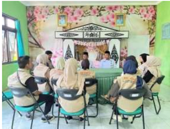
Gambar 1. Meminta data tanah wakaf di KUA Karangdadap

Wakaf secara bahasa berasal dari kata waqafa yang berarti menahan, berhenti, atau tetap pada posisinya. Kata ini memiliki makna serupa dengan habasa. Sedangkan menurut syariat, wakaf adalah tindakan menahan suatu harta pada pokok atau asalnya dan memanfaatkan hasil atau manfaatnya untuk kepentingan di jalan Allah. Dengan kata lain, harta wakaf tidak boleh dialihkan kepemilikannya, tetapi digunakan untuk memberikan manfaat bagi kebaikan (Abidin, 2023).