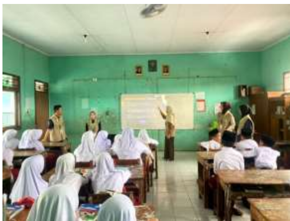
Gambar 4. Sosialisasi anti bullying di MIS Karangdadap

Bullying merupakan sebuah fenomena sosial yang kerap muncul di berbagai lingkungan, termasuk di Sekolah MI Salafiyah Karangdadap. Pentingnya sosialisasi terkait bullying bagi anak-anak SD menjadi perhatian karena perilaku tersebut dapat memengaruhi perkembangan fisik, emosional, dan sosial mereka (Hopeman, 2020). Sementara itu, menurut Albert Bandura, perilaku bullying muncul melalui proses belajar sosial, yaitu dengan meniru, mengamati, dan berinteraksi dengan lingkungan sekitar. Anak memperoleh contoh dari orang-orang di sekelilingnya seperti teman, guru, bahkan dari media.