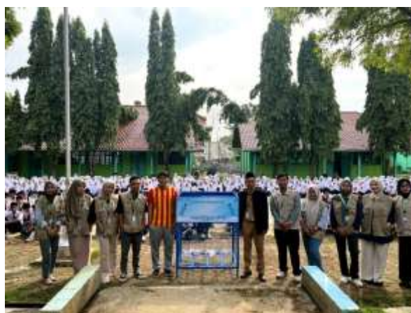
Gambar 3. Sosialisasi Bank Sampah di SMP NU Karangdadap

Penerapan bank sampah di tingkat SMP merupakan upaya edukatif yang memperkenalkan konsep pengelolaan sampah kering dengan sistem seperti perbankan, di mana siswa berperan sebagai “nasabah” yang menabung sampah bernilai ekonomis, seperti plastik, kertas, dan logam. Sampah yang disetorkan kemudian dipilah, dicatat sebagai saldo tabungan, dan dikumpulkan untuk disalurkan ke industri daur ulang. Selain berkontribusi pada upaya pengurangan sampah melalui prinsip 3R (Reduce, Reuse, Recycle), kegiatan ini juga menjadi sarana rekayasa sosial yang mendorong terbentuknya perilaku ramah lingkungan sekaligus memberikan manfaat ekonomi sederhana bagi para peserta didik (Maryuni, 2024).